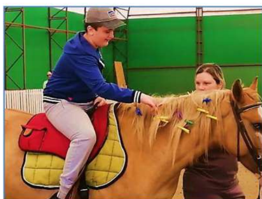
ФОТО ОБЪЕКТИВ - НАШИ УВЛЕЧЕНИЯ

В свободное время мне нравится вязать руками. На данный момент я уже связала 3 пледа, 3 шарфа и шаль. И еще я планирую научиться вязать жилетки, шапочки и другие интересные вещи. Вязать я научилась сама по урокам в интернете. Для техники вязания руками используется специальная пряжа. Она на ощупь очень мягкая и толстая, похожая на плюш. В итоге получаются мягкие и нежные изделия. Сейчас я учусь вязать крючком. Крючком можно вязать коврики, салфетки, игрушки, одежду и многое другое. В планах стоит получение заказов на свои изделия. Я получаю огромное удовольствие от вязания, оно меня успокаивает и настраивает на положительные мысли!